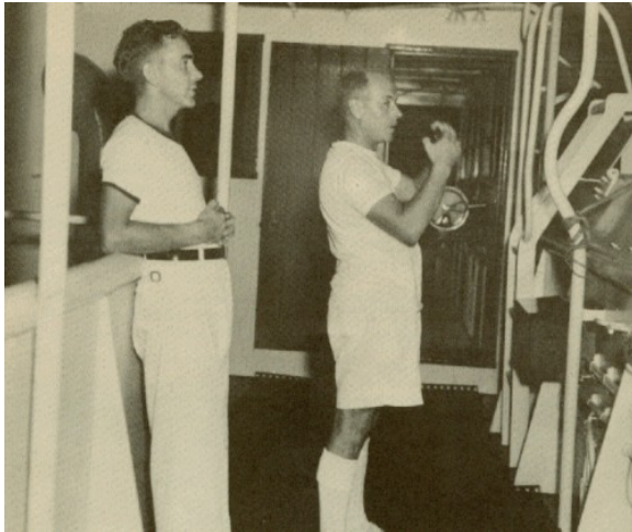
Dos oficial riba e bridge

tabata un poco mas grandi cu e otro tankeronan. E flota di tankeronan aki a dura te ora cu e funcionamiento di Aruba-Lago Maracaibo a termina na aña 1925. Hopi di nan tabata eyan for di cuminsamento te na fin, te ora cu e canalnan di Lago Maracaibo pa lama grandi a wordo coba pa tuma tankeronan grandi. E mesun aña ey, un bahia na San Nicolas na e parti pariba di e rif tambe mester a ser cobá y haci'e mas hancho pa e entrada di tankeronan grandi. Pa haya e bahia aki den un bon forma, hopi cortamento mester a wordo haci na e entrada smal y hopi trabou di draga den e bahia mes.